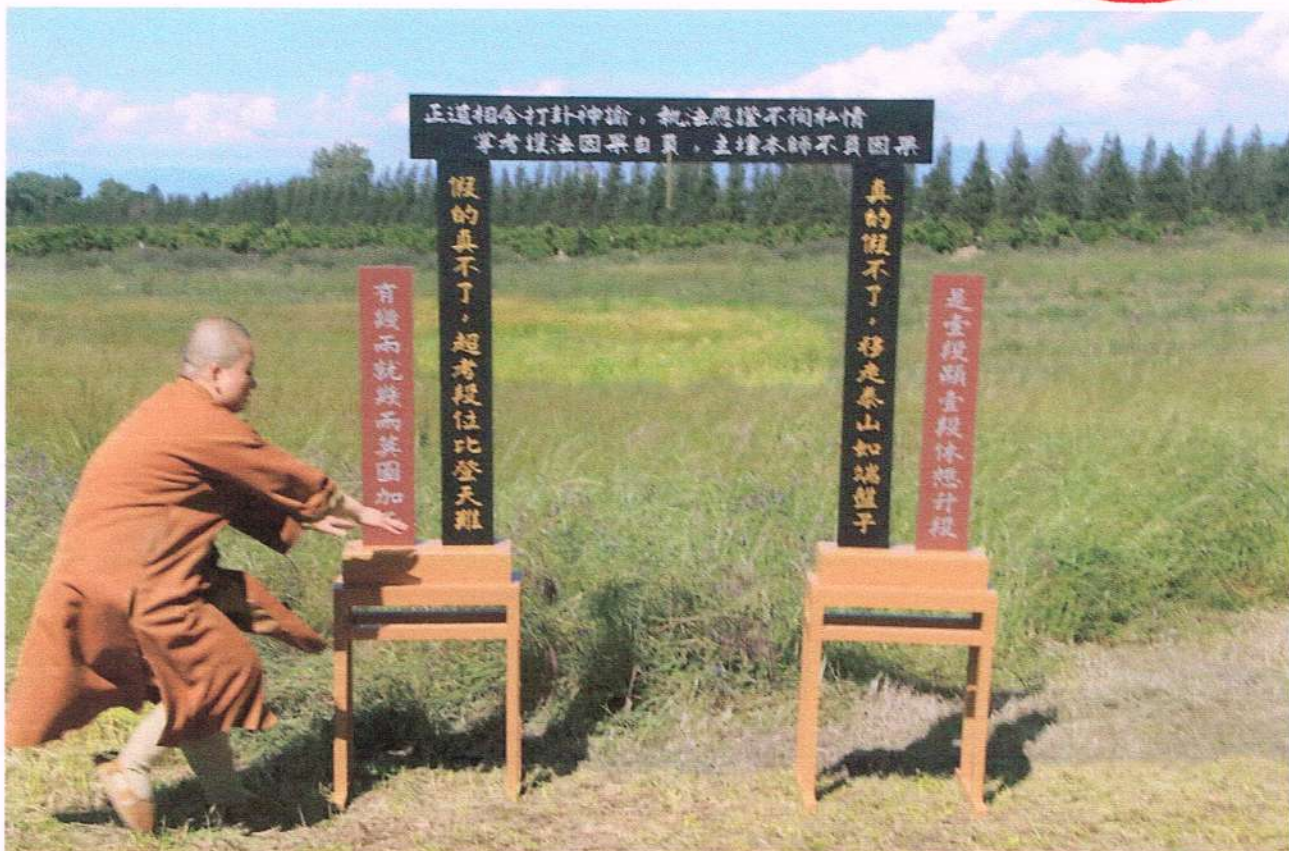
法師正準備進入陣門聖考，突然陣內爆發強大旋風，使之無法站穩腳跟，活活被吸進陣中。